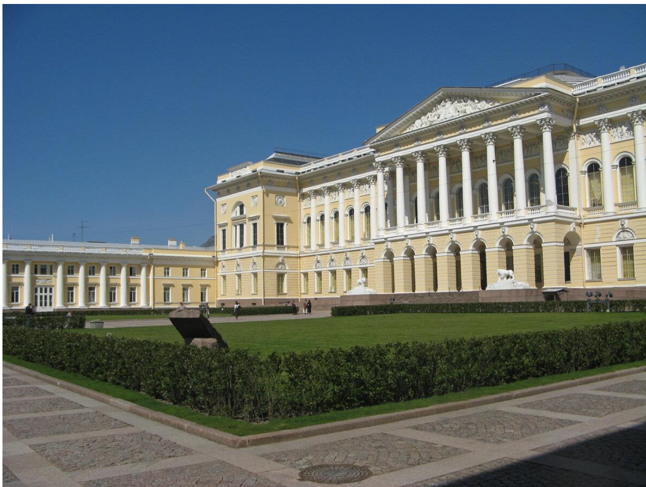
Государственный русский музей